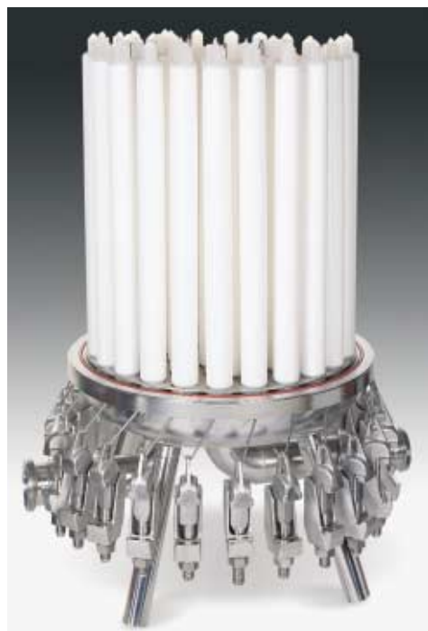
Caudal para agua a través de elementos de 10" de Sartopure PP2.

Nuestro departamento de aplicaciones está a su entera disposición, tanto para cuestiones técnicas referentes a las especificaciones de nuestros productos de filtración, como para asesoramiento a la hora de seleccionar un producto. Podemos realizar ensayos de filtrabilidad, tanto en nuestros laboratorios como en sus instalaciones, para seleccionar el producto de filtración más apropiado y optimizar su proceso de filtración.